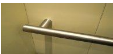
PASAMANOS TUBULAR RECTO