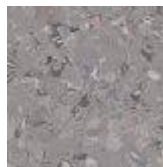
LINOLEUM VERDE LINOLEUM MARRON LINOLEUM GRIS